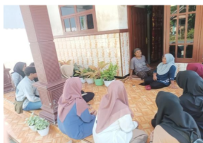
Gambar 1. Observasi UMKM Marning