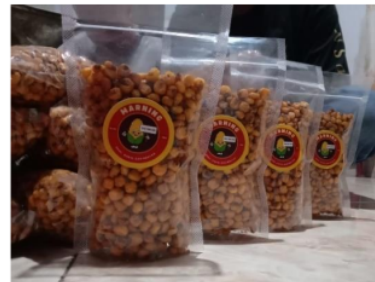
Gambar 3. Pendampingan penguatan branding dan inovasi kemasan produk